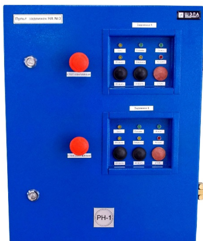
Пульт управления задвижками ПЗ-2 (на две задвижки)