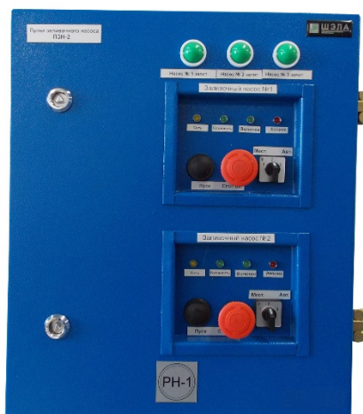
Пульт заливочных насосов ПЗН-2 (на два насоса)