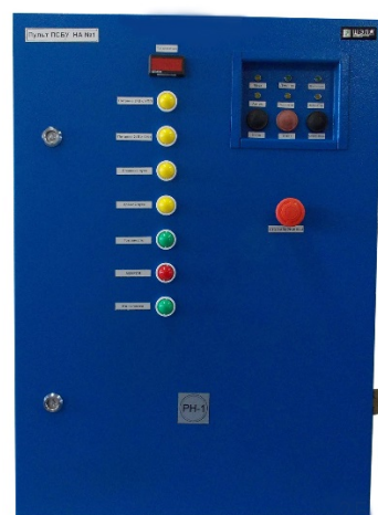
Пульт сигнализации и блокировок главного насоса ПСБУ-1